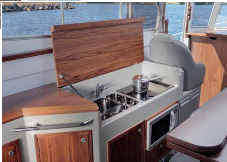
Hyvin varusteltu pentteri löytyy salonkia vastapäätä vasemmalta laidalta. Liesi ja altaat on sijoitettu vierekkäin avattavan tason alle. Ratkaisu on siisti, sillä toiminnot saa piiloon kannen alla. Laskutilaa on kuitenkin niukalti.

36-jalkaisen Minorin sisätilat ovat kauttaaltaan väljät ja toimivat. Vakiona oleva pähkinäpuu tuo lämpimän kontrastin muutoin harmaitiin ja vaaleisiin pintoihin. Veneen tilaratkaisut ovat vakioituneet, eikä tilojen varioimiseen ole siten mahdollisuutta.