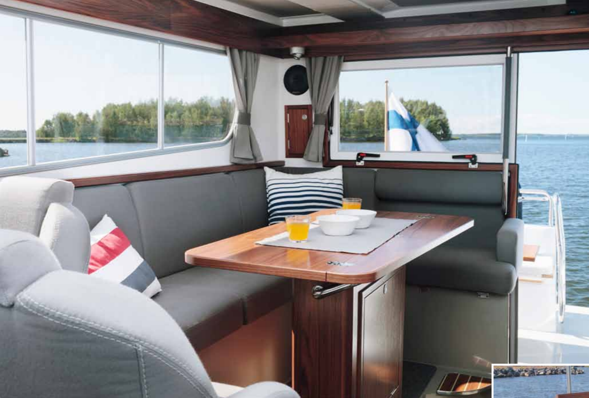
Hytin takaosaan oikealle laidalle sijoitettu salonki muodostuu sohvast ja pöydästä, jonka jalkaan on sijoitettu baarikaappi. Näkyvyys ulos on hyvä ja takakannen ikkunan saa kokonaan avattua.