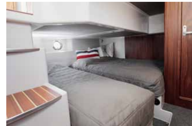
Taaempi makuuhuytin sijaitsee keskellä venettä. Vuodepaikkoja on kolme.